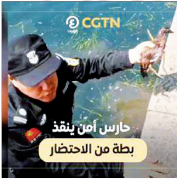
حارس أمن ينقذ بطة من الاحتضار

أنقذ حارس أمن صيني بطة تحتضر كانت محاصرة في الأعشاب المائية المتشابكة. وعلقت بطة الماندرين الصغيرة بأعشاب المياه في البحيرة الغربية بمدينة هانغتشو شرقي الصين. وعندما رأى حارس الأمن هذا المشهد، ألقي نفسه في الماء على الفور وقطع الأعشاب المتشابكة بمقص، وأمسك البطة بيديه. وأسرع حارس الأمن بخطواته لإعادة البطة الضائعة إلى أصمها، ولاقضى تصفيقا من السياح المارين لتقدير تصرفه الحسن.